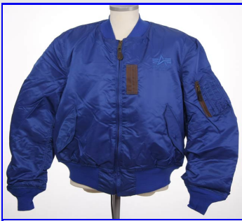
Bomber MA-1 Flight Series Vintage Made in USA